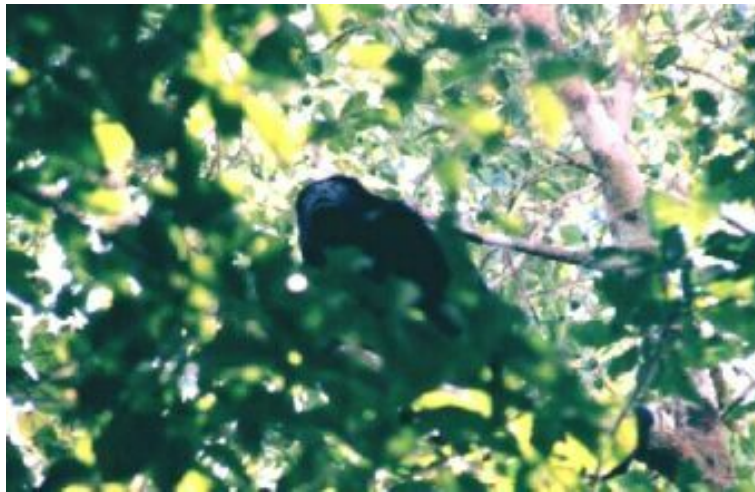
Un mono aullador (Alouatta pigra), especie endémica regional