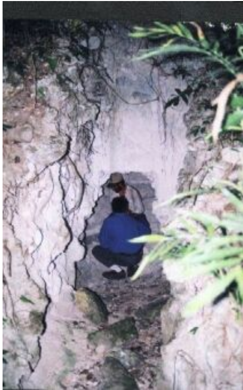
Excavación arqueológica ilegal. Un "hueche" que encontramos en la última visita de campo. La profundidad y la envergadura de la obra indica que fueron varias personas las que lo hicieron. Foto tomada en las cercanías del sitio arqueológico Naachtún