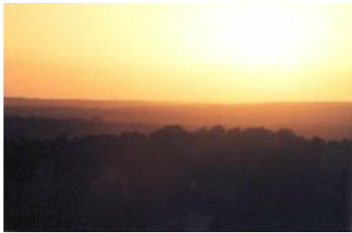
Atardecer en Naachtún Dos Lagunas

La altitud varía desde los 100 hasta los 300 m. La temperatura media anual es de 25° C. Según los datos de la estación meteorológica de Tikal, la más cercana del área, el rango de temperaturas oscila entre 20° C y 30,7° C. La temperatura media inferior no suele bajar de 18° C. La precipitación media anual se sitúa entre 1.160 a 1.700 mm, con tres meses secos, entre febrero y mayo (CECON 1996).