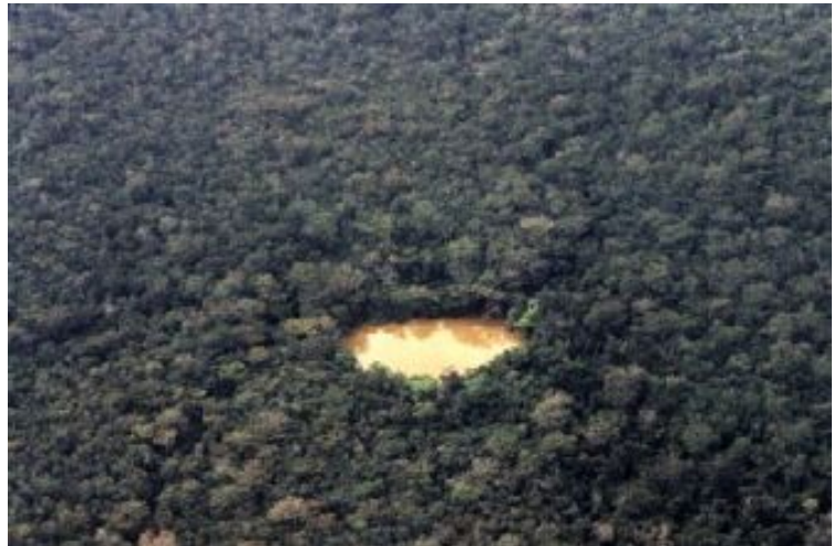
Laguna el Suspiro situada en el noroeste del biotopo. Laguna de agua salada que tiene restos arqueológicos en sus orillas. Es el cuerpo de agua más sobresaliente del área en época seca